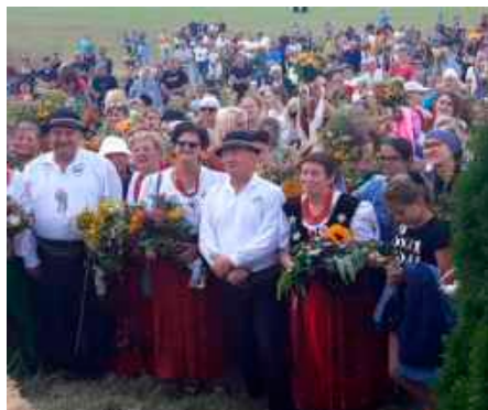
fol. GBIOK w Niedźwiedziu

Dużymi walorami turystycznymi cieszą się wspomniane wcześniej góry Witów i Potaczkowa. Pierwszą z nich z uwagi na dogodne warunki awiacyjne chętnie odwiedzają miłośnicy lotniarstwa, gdyż stanowi znakomity punkt startowy dla miłośników tego rodzaju aktywności fizycznej. Na drugiej