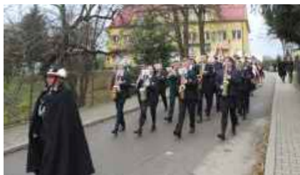
fol. GBIOK w Niedźwiedziu

Prężnie działają także koła gospodyń wiejskich, które promują regionalną kuchnię, uświetniają wszystkie gminne imprezy oraz uczestniczą w licznych konkursach. Wśród mieszkańców możemy także znaleźć rzeźbiarzy, malarzy, rzemieślników, którzy kultywują lokalne rzemiosło i sztukę ludową, charakterystyczną dla naszego regionu. Wytwory ich pracy mogą być cenną pamiątką z naszego terenu. Regionalizm przeżywa obecnie na naszym terenie dynamiczny rozkwit, czego wyrazem są liczne laury zdobywane przez zespoły regionalne na festiwalach folklorystycznych. Utrwalaniu tego procesu służą także działania instytucji oraz organizowane imprezy regionalne w gminie.