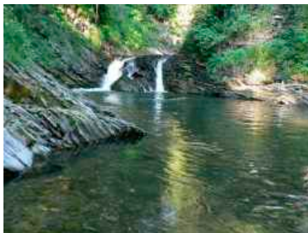
fol. UG Niedźwiedź