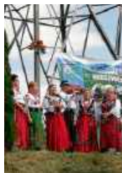
fol. GBIOK w Niedźwiedziu