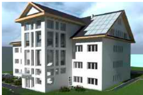
fol. UG Niedźwiedź