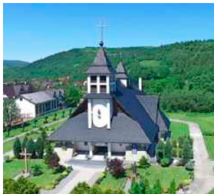
fol. UG Niedźwiedź

Miejscowość Niedźwiedź położona jest u zbiegu doliny Koniny i Porębianki na wysokości sięgającej do 500 m. n.p.m. Zamieszkuje ją około 1400 mieszkańców. Wieś charakteryzuje się ciekawą zabudową, gdyż w odróżnieniu od większości góralskich wsi, nie ciągnie się wzdłuż jednego traktu, lecz przypomina małe miasteczko. W środku znajduje się rynek, od którego odchodzą wąskie uliczki. Niedźwiedź stanowi centrum administracyjne dla pozostałych miejscowości. Mieści się tu urząd gminy będący siedzibą władz gminnych, który obecnie jest remontowany, a wizualizacja stanu końcowego przedstawiona została na poniższych zdjęciach. Południowa część wsi znajduje się w otulinie Gorczańskiego Parku Narodowego.