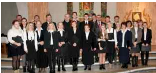
fol. GBIOK w Niedźwiedziu