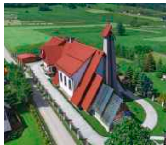
fol. UG Niedźwiedź

Konina to zagórzańska wioska położona u podnóża Turbaczyka, na północnych stokach Gorców w dolinie potoku Konina. Zamieszkiwana jest przez ok. 2290 mieszkańców, którzy charakteryzują się silnym przywiązaniem do tradycji i kultury. Powierzchnia wsi zajmuje obszar 2690 ha, natomiast zabudowa sięga do wysokości 650 m. n.p.m. Wieś została założona w 1398 r. przez Cystersów. Nazwa miejscowości początkowo brzmiała „Kurzyzna”, od dymów pochodzących z huty szkła. Błąd urzędniczy doprowadził jednak do zmiany nazwy na Kunina, którą następnie zamieniono na Konina. Nazwa miejscowości pochodzi więc od słowa „kurzy się”, a nie od słowa „konie”, jak większość uważa.