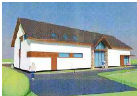
fol. UG Niedźwiedź

W Koninie do dziś górale mówią starą gwarą Zagórczan charakterystyczną dla tego regionu. Dodatkowo w tej miejscowości można jeszcze zobaczyć zanikającą już tradycyjną, góralską zabudowę. Mieszkańcy sołectwa są w trakcie budowy obiektu turystyczno-rekreacyjnego, widocznego na poniższej wizualizacji.