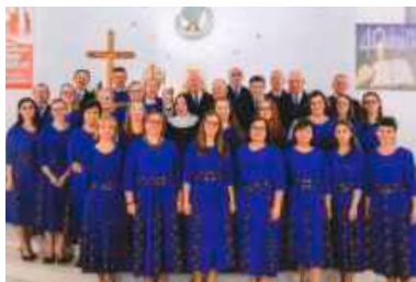
fol. J. Haras