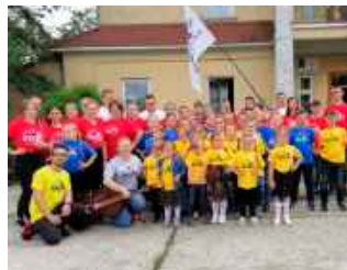
fol. GBIOK w Niedźwiedziu