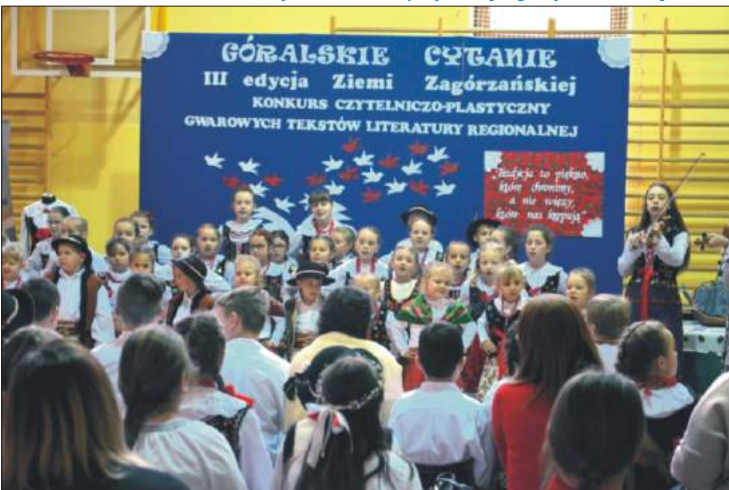
Góralskie Cytanie - etap wojewódzki w Łostówce