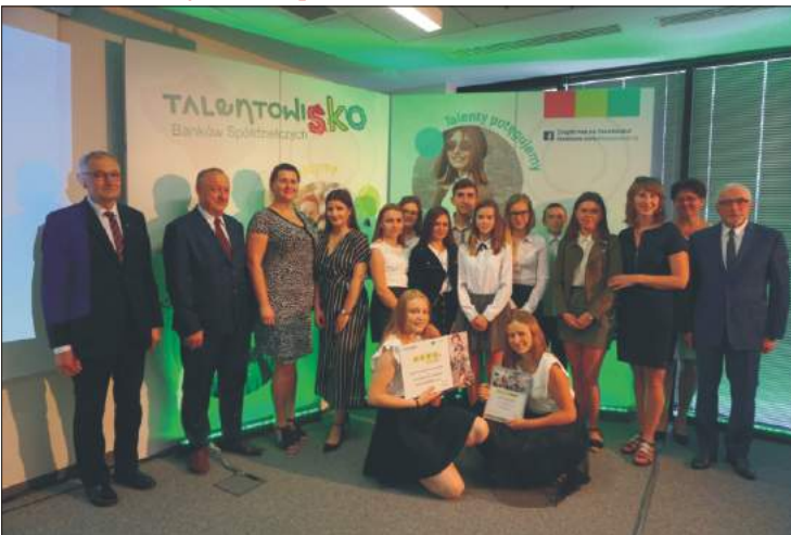
Uczniowie z Koniny okazali się być najlepszymi w kraju