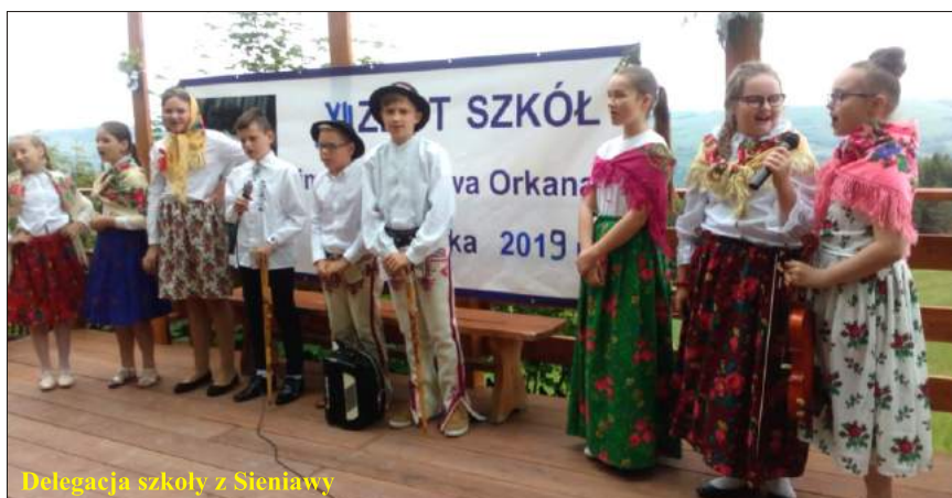
Delegacja szkoły z Sieniawy

Delegacje szkół biorące udział w Zlocie, prezentowały wybrane przez siebie fragmenty utworów pisarza. Aktorzy zauroczyli widow-