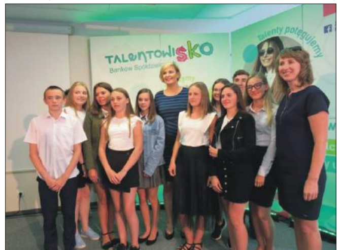
W stolicy spotkali się między innymi z Otylią Jędrzejczak