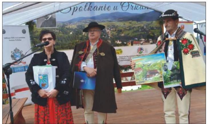
Majówka i Spotkanie u Orkana w ramach obchodów 100 rocznicy założenia Związku Podhalan w Polsce