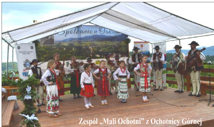
Zespół „Mali Ochotni” z Ochotnicy Górnej

Chętni mieli okazję zwiedzić Orkanówkę oraz otrzymać przewodnik i gadżety gminy, a wszyscy uczestnicy imprezy mogli skosztować pysznych specjałów, przygotowanych przez Koła Gospodyń Wiejskich z Poręby Wielkiej, Podobina oraz Koniny na degustację potraw regionalnych.