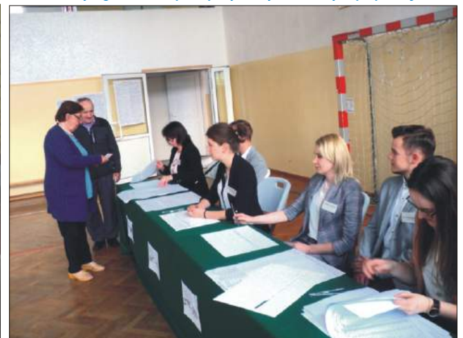
Wybory do Parlamentu Europejskiego - lokal w Koninie

Wydawca: Urząd Gminy w Niedźwiedziu, 34 - 735 Niedźwiedź, tel: 18 331 70 02 Zespół redakcyjny: Stanisław Stopa (opracowanie, skład komputerowy) Anna Liberda - współpraca redakcyjna Przygotowanie edytorskie - Paweł Zelek Adres internetowy: www.niedzwiedz.iap.pl Poczta elektroniczna: gmina@niedzwiedz.iap.pl Druk: MM - Limanowa, tel. 18 337 01 10, www.mm.limanowa.pl Pismo zrzeszone w Polskim Stowarzyszeniu Prasy Lokalnej