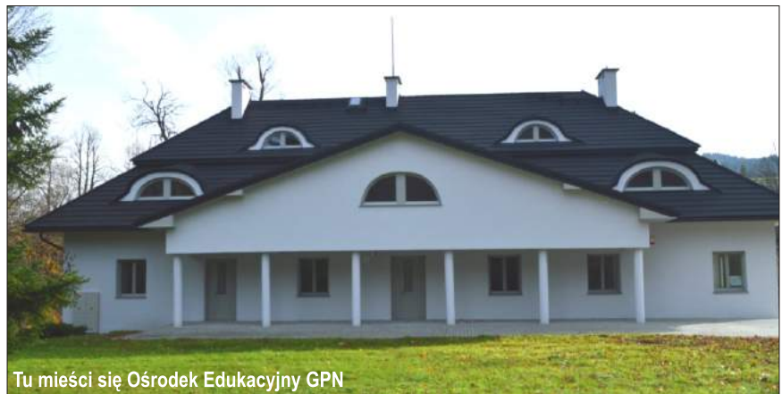
Tu mieści się Ośrodek Edukacyjny GPN

Dzięki projektowi poszerzyliśmy system alejek spacerowych w dolnej części parku dworskiego, postawiliśmy ponad 20 ławek. Powstał bindaż i niewielka platforma widokowa w górnej części parku, z której