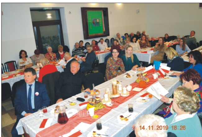
Wieczornica dla seniorów z okazji Święta Niepodległości