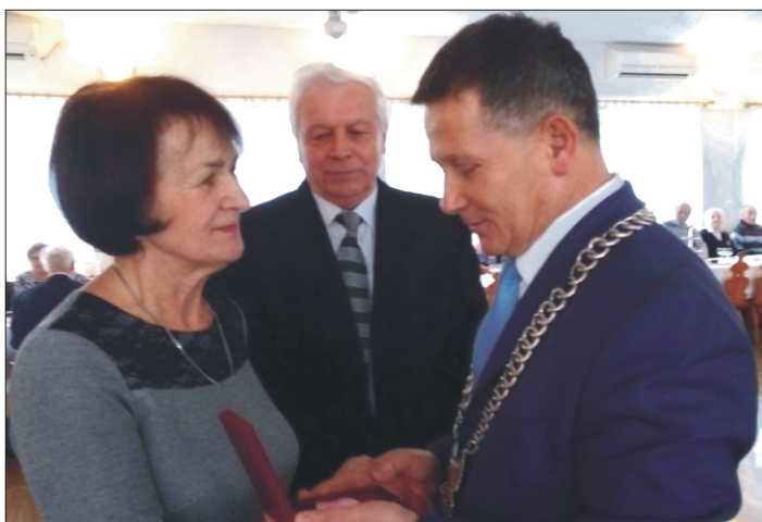
Gminna uroczystość Złotych Godów