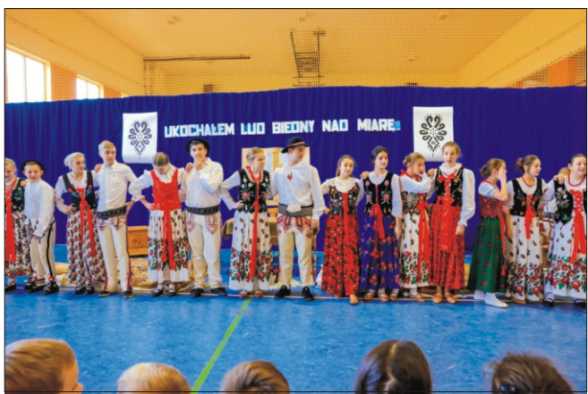
Święto szkoły w Porębie Wielkiej