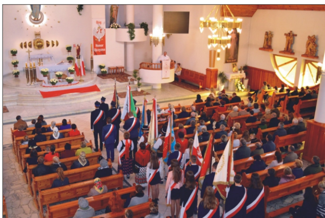
Gminna uroczystość Święta Niepodległości