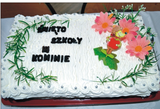
Święto szkoły w Koninie