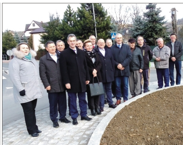
Oddanie wyremontowanego odcinka drogi powiatowej

Wydawca: Urząd Gminy w Niedźwiedziu, 34 -735 Niedźwiedź, tel: 18 331 70 02 Zespół redakcyjny: Stanisław Stopa (opracowanie, skład komputerowy) Anna Liberda - współpraca redakcyjna Przygotowanie i opracowanie wersji internetowej - Stanisław Stopa Adres internetowy: www.niedzwiedz.iap.pl Poczta elektroniczna: gmina@niedzwiedz.iap.pl Pismo zrzeszone w Polskim Stowarzyszeniu Prasy Lokalnej