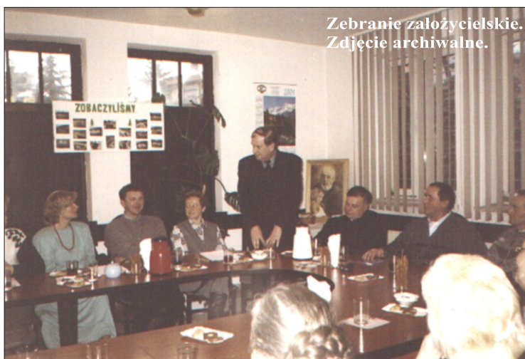
Zebranie założycielskie. Zdjęcie archiwalne.