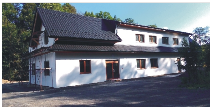
Nowa siedziba Oddziału Związku Podhalan w Niedźwiedziu