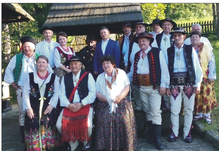
Posiedzenie Zarządu Głównego Związku Podhalan na „Orkanówce” - 6 sierpień 2020.