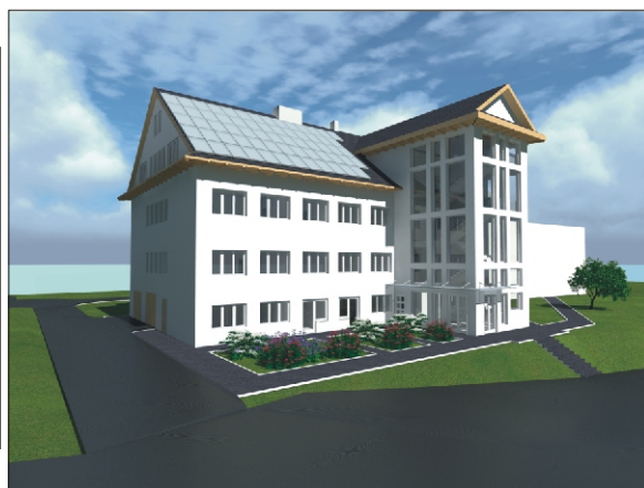
Widok budynku Urzędu Gminy po modernizacji

Wydawca: Urząd Gminy w Niedźwiedziu, 34 -735 Niedźwiedź, tel: 18 331 70 02 Zespół redakcyjny: Stanisław Stopa (opracowanie, skład komputerowy) Anna Liberda - współpraca redakcyjna Opracowanie i przygotowanie wersji internetowej - Stanisław Stopa Adres internetowy: www.niedzwiedz.iap.pl Poczta elektroniczna: gmina@niedzwiedz.iap.pl Pismo zrzeszone w Polskim Stowarzyszeniu Prasy Lokalnej