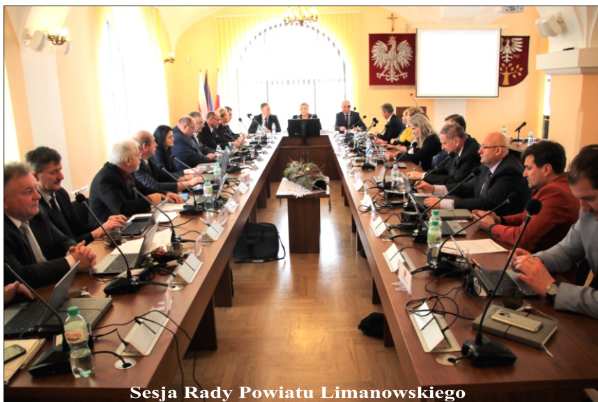
Sesja Rady Powiatu Limanowskiego

Nie miałem określonych zadań do realizacji po uzyskaniu mandatu radnego. Zostały one opracowane dopiero w trakcie.