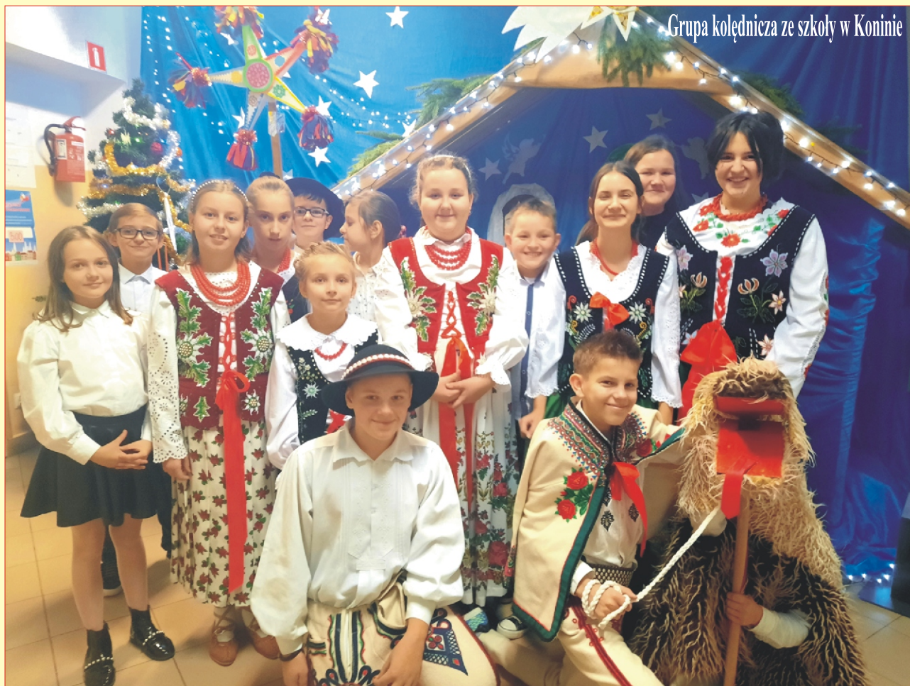
Grupa kolędnicza ze szkoły w Koninie

Rok XXVII - nr 128 Październik - Listopad - Grudzień '2021 Cena 3 zł