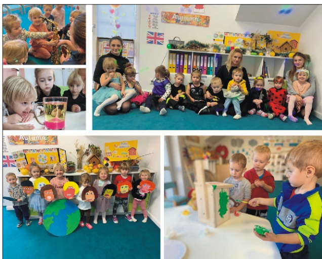
„MarzyMisie” - pierwsze prywatne przedszkole w gminie