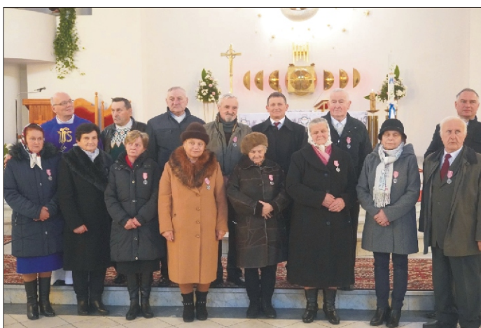
Jubileusz 50-lecia pożycia małżeńskiego

Wydawca: Urząd Gminy w Niedźwiedziu, 34 -735 Niedźwiedź, tel: 18 331 70 02 Zespół redakcyjny: Stanisław Stopa (opracowanie, skład komputerowy) Anna Liberda - współpraca redakcyjna Przygotowanie i opracowanie wersji internetowej - Stanisław Stopa Adres internetowy: www.niedzwiedz.iap.pl Poczta elektroniczna: gmina@niedzwiedz.iap.pl Pismo zrzeszone w Polskim Stowarzyszeniu Prasy Lokalnej