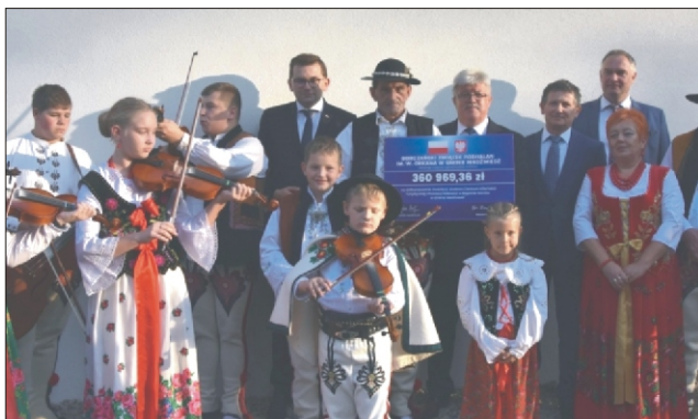
Czek finansowy dla naszego Oddziału Związku Podhalan