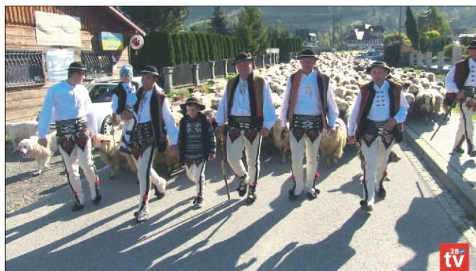
Redyk Jesienny 2021