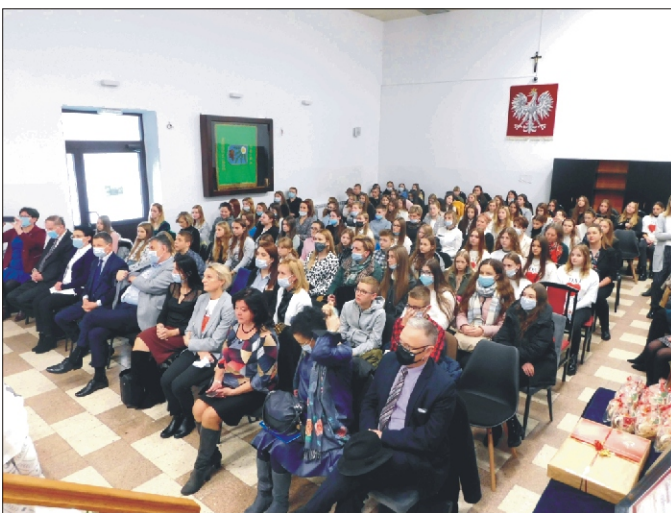
I Gala Wolontariatu w naszej Gminie