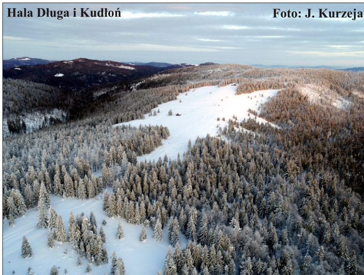
Hala Długa i Kudłoń

w monitoringu zmian krajobrazu i skutków podejmowanych działań ochronnych. Kolejnym, finansowanym ze źródeł Narodowego Funduszu Ochrony Środowiska i Gospodarki Wodnej oraz własnych Parku, był kontynuowany od 2019 r. projekt: „Ochrona i przywracanie różnorodności biologicznej i krajobrazowej na obszarze zabytkowego założenia parkowego w Porębie Wielkiej”. Jego najważniejszym, a zarazem wymagającym najwięcej