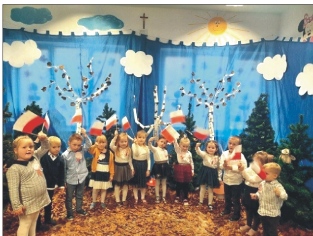
Święto Niepodległości u przedszkolaków w Koninie