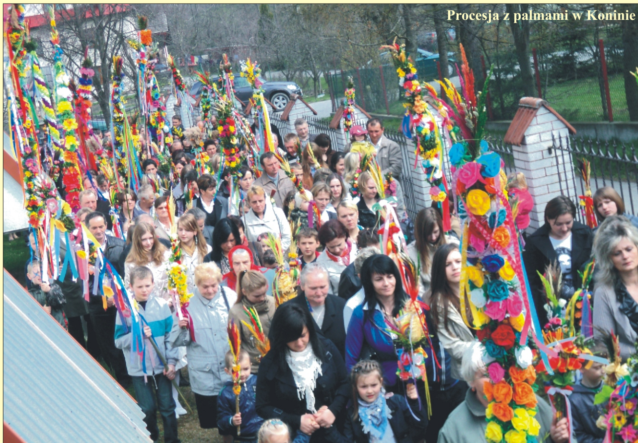
Procesja z palmami w Koninie

Zdrowych, spokojnych i radosnych Świąt Zmartwychwstania Pańskiego zyczą Wydawca i Redakcja