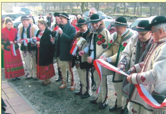
Nasi Podhalanie mają nową, własną siedzibę