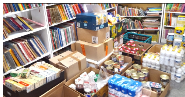
Po lewej: Panie z Charkowa i Krematorska. Gminny Ośrodek Kultury - dary od mieszkańców naszej Gminy.