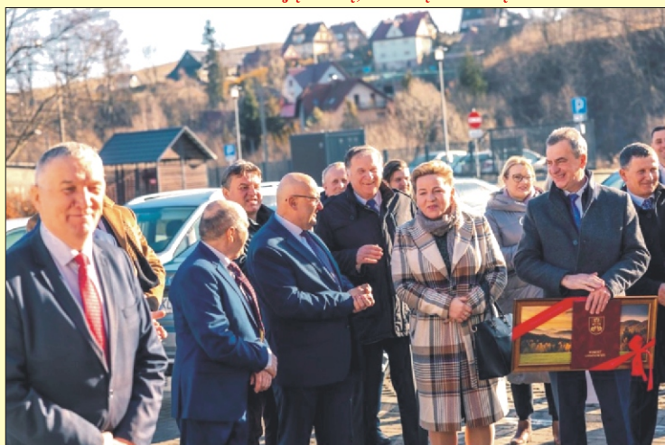
Oficjalne otwarcie Zakładu Balneologii