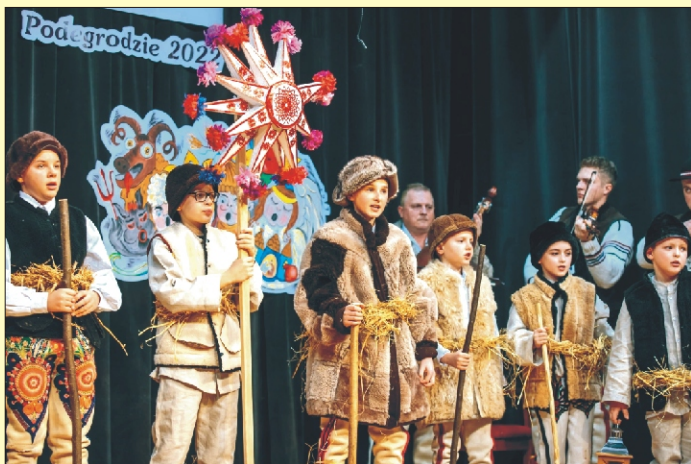
„Pastuszkowe kolędowanie” w Podgrodzie - III miejsce dla grupy kolędniczej z Niedźwiedzia