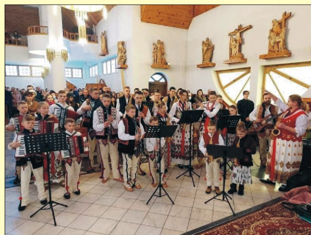
Orkiestra św. Sebastiana z Niedźwiedzia ma za sobą pierwszy rok grania i śpiewania