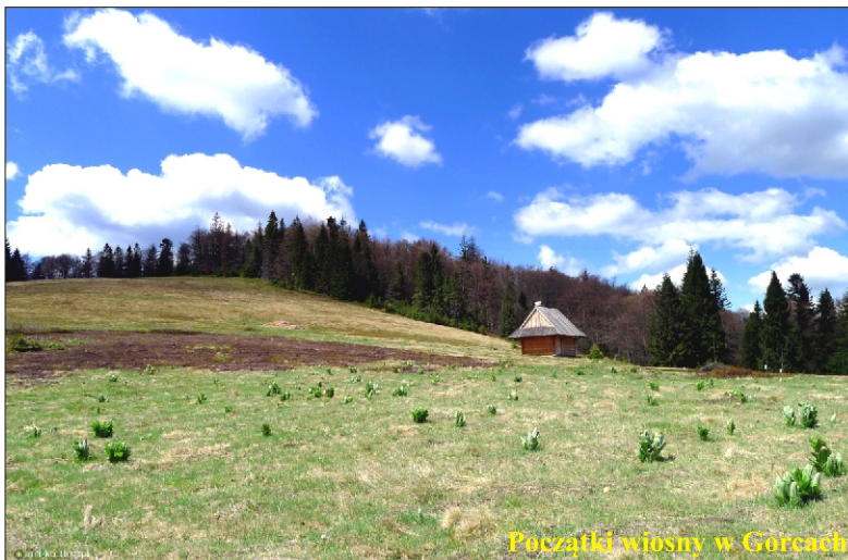
Początki wiosny w Gorcach

W 2022 roku będziemy kontynuować imprezy plenerowe dla społeczności lokalnej i turystów „Niedziela w Gorceńskim Parku Narodowym”.