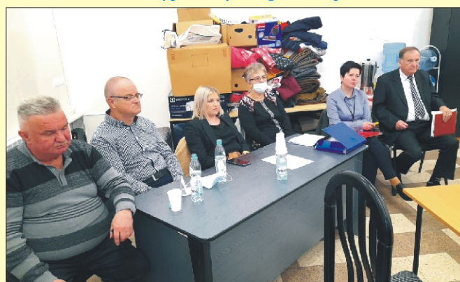
Sołtysi (za stolikiem) na marcowej sesji Rady Gminy