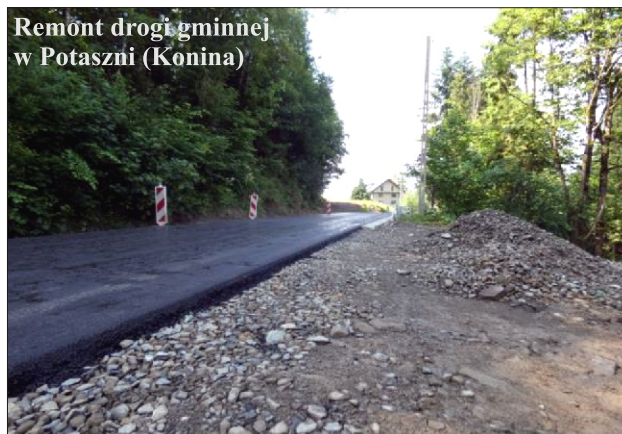
Remont drogi gminnej w Potasznii (Konina)

W roku 2021 u pacjentów NZOZ w Porębie Wielkiej rozpoznano: choroby układu krążenia - 1 369 przypadków, otyłość -131, cukrzyca - 292, choroby tarczycy - 181, nowotwory - 99, przewlekłe nieżyty oskrzeli - 134, przewlekłe choroby układu trawiennego - 271, choroby układu mięśniowo-kostnego - 568 przypadków.