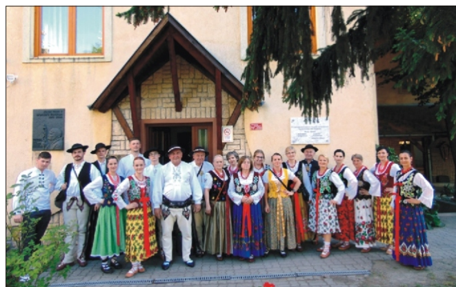
Zespół „Spod Turbaca” gościł na Węgrzech