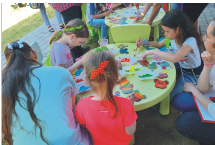
Polsko-ukraiński piknik rodzinny