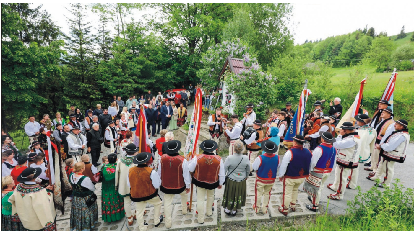
Powyżej: Majówka u Orkana. Niżej: Integracyjny Powiatowy Piknik Rodzinny w Porębie Wielkiej