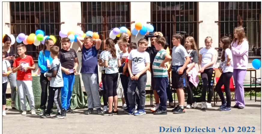
Dzień Dziecka 'AD 2022

Jakość kształcenia mierzona wynikami egzaminu ósmoklasisty jest na dobrym poziomie. Osiągamy wysokie wyniki w konkursach przedmiotowych, tematycznych, artystycznych oraz zawodach sportowych. Już w czasie pełnienia funkcji p.o. dyrektora, możemy pochwalić się zdobyciem I miejsca w XI edycji Konkursu Małopolskiego „Odblaskowa Szkoła”, gdzie główną nagrodą był bon na sumę 4500 zł. Dzięki bardzo dobrej współpracy z Radą Rodziców, która dołożyła 1200 zł, udało się zakupić dwa projektory. W VII Ogólnopolskim Kon-