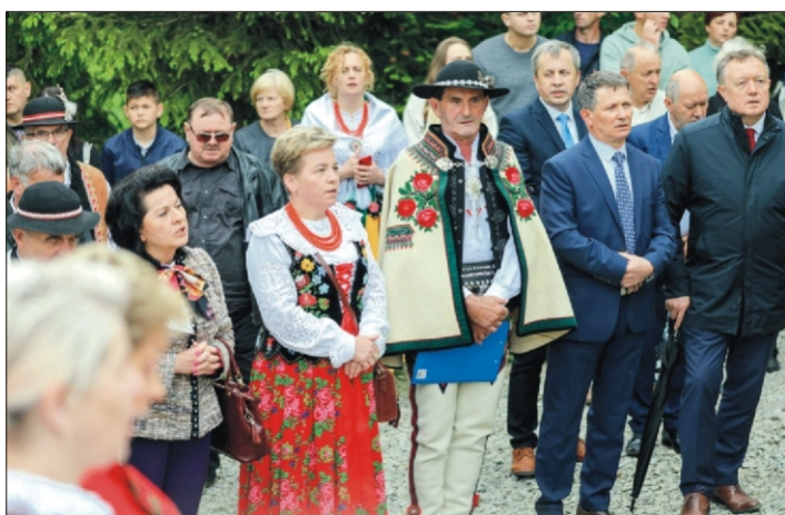
Majówka u Orkana - śpiew litanii loretańskiej