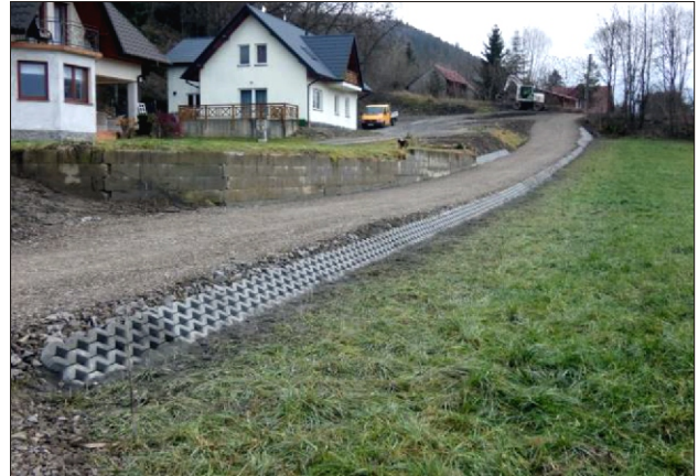
Remont drogi na osiedlu Zawady w Podobinie