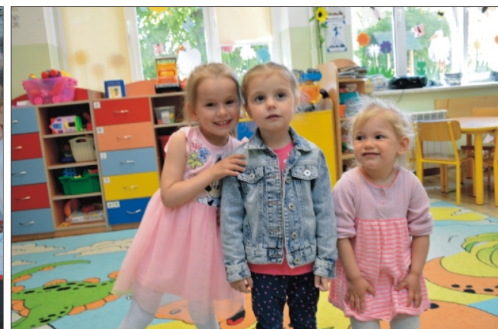
Ukraińskie słodziaki z przedszkola w Koninie

Wydawca: Urząd Gminy w Niedzwiedziu, 34 -735 Niedzwiedź, tel: 18 331 70 02 Zespół redakcyjny: Stanisław Stopa (opracowanie, skład komputerowy) Anna Liberda - współpraca redakcyjna Opracowanie i przygotowanie wersji internetowej - Stanisław Stopa Adres internetowej: www.niedzwiedz.iap.pl Poczta elektroniczna: gmina@niedzwiedz.iap.pl Pismo zrzeszone w Polskim Stowarzyszeniu Prasy Lokalnej