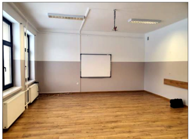
Remont klas w szkole w Niedźwiedziu