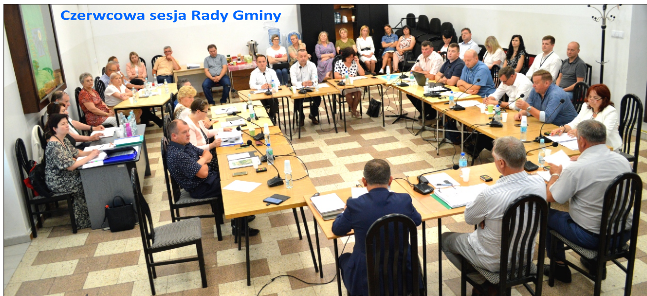
Czerwcowe sesja Rady Gminy