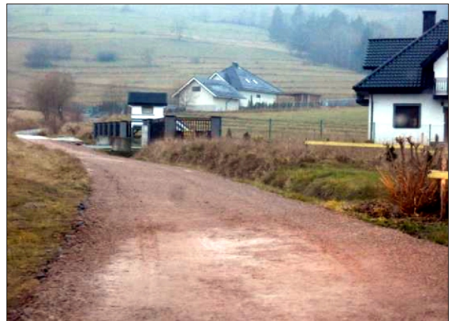
Remont drogi na osiedlu Zagrody w Koninie