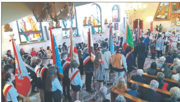
Gminna uroczystość 3 Maja w Koninie