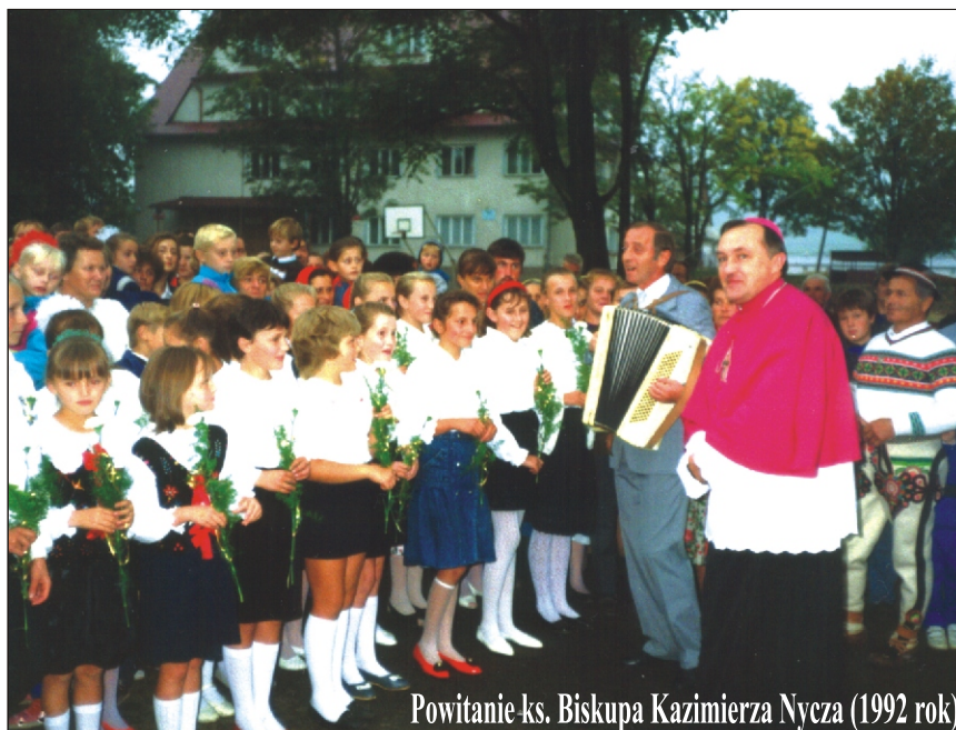
Powitanie ks. Biskupa Kazimierza Nycza (1992 rok)