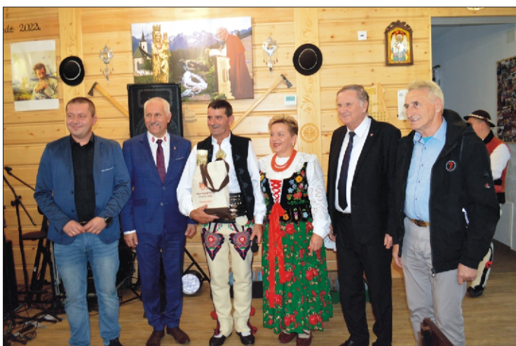
Uroczystości związane z obchodami 20 - lecia Gorczańskiego Oddziału Związku Podhalan w Niedźwiedziu