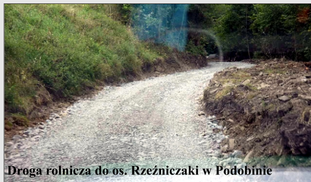
Droga rolnicza do os. Rzeźniczaki w Podobinie