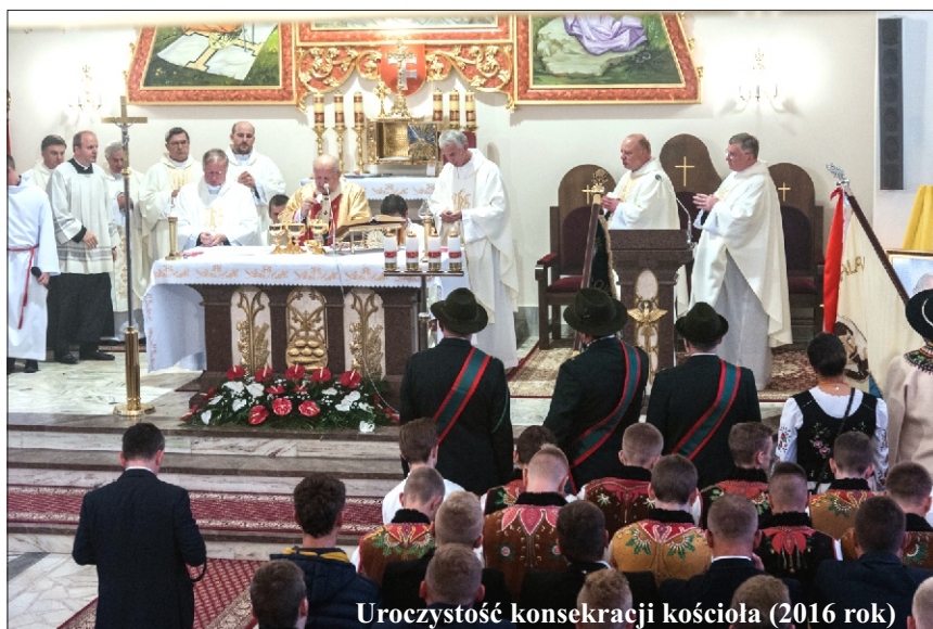
Uroczystość konsekracji kościoła (2016 rok)

Przed kościołem wzniesiono kapliczkę MB Różańcowej, którą poświęcił Ks. Kardynał Stanisław Dziwisz w dniu konsekracji kościoła (9 października 2016 roku).