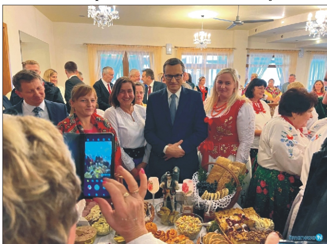
II Kongres KGW w Kamienicy