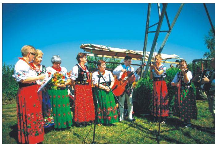
Spotkanie na Górze Potaczkowej