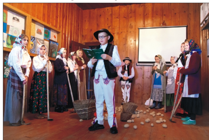
Złot szkół orkanowskich

Wydawca: Urząd Gminy w Niedźwiedziu, 34 -735 Niedźwiedź, tel: 18 331 70 02 Zespół redakcyjny: Stanisław Stopa (opracowanie, skład komputerowy) Anna Liberda - współpraca redakcyjna Opracowanie i przygotowanie wersji internetowej - Stanisław Stopa Adres internetowy: www.niedzwiedz.iap.pl Poczta elektroniczna: gmina@niedzwiedz.iap.pl Pismo zrzeszone w Polskim Stowarzyszeniu Prasy Lokalnej