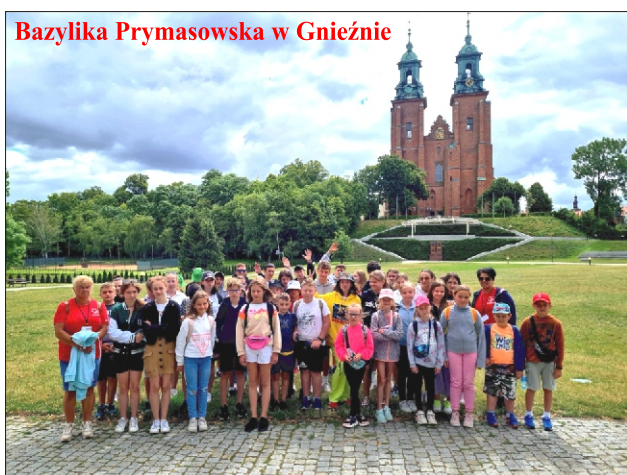
Bazylika Prymasowska w Gnieźnie