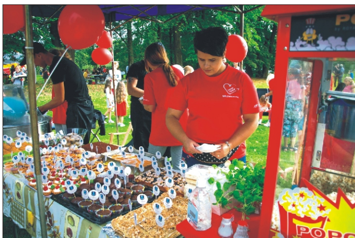
Pożegnanie „Lata pod Turbaczem”.