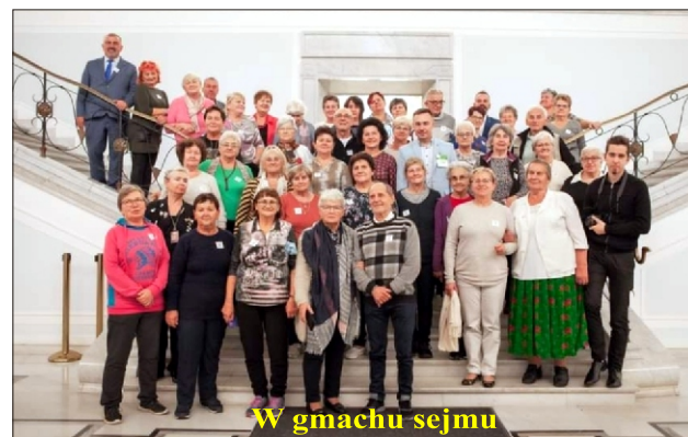
W gmachu sejmu

Uroczystości na Stadionie Narodowym zostały udostępnione na kanale You Tube przez głównego Organizatora czyli Ministerstwo Rodziny i Polityki Społecznej. Fantastyczna zabawa i godne reprezentowanie Małopolski zostanie na długo zapamiętane nie tylko przez uczestników, ale również jest doskonałym doświadczeniem