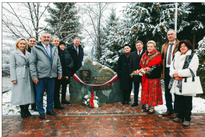
Odślonięcie obelisku Władysława Orkana w Porębie Wielkiej