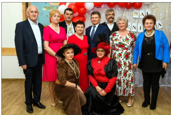
Bal Seniora w naszej gminie