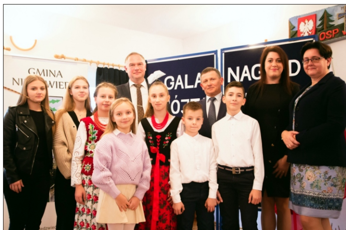
Uroczysta Gala z wręczeniem Listów Gratulacyjnych dla uczniów