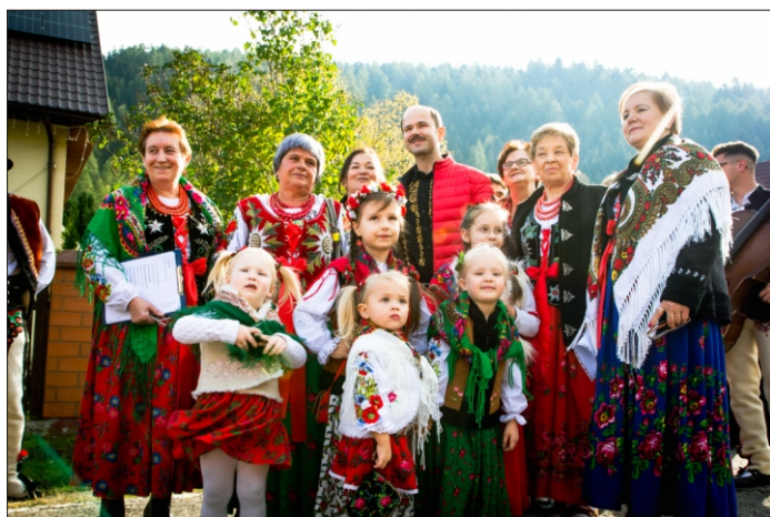
Oprawa artystyczna III Redyku Jesiennego