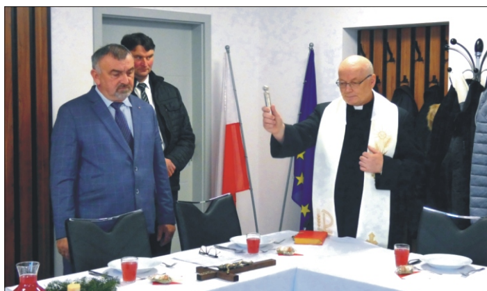
Poświęcenie nowej sali obrad w Urzędzie Gminy

Wydawca: Urząd Gminy w Niedźwiedziu, 34 -735 Niedźwiedź, tel: 18 331 70 02