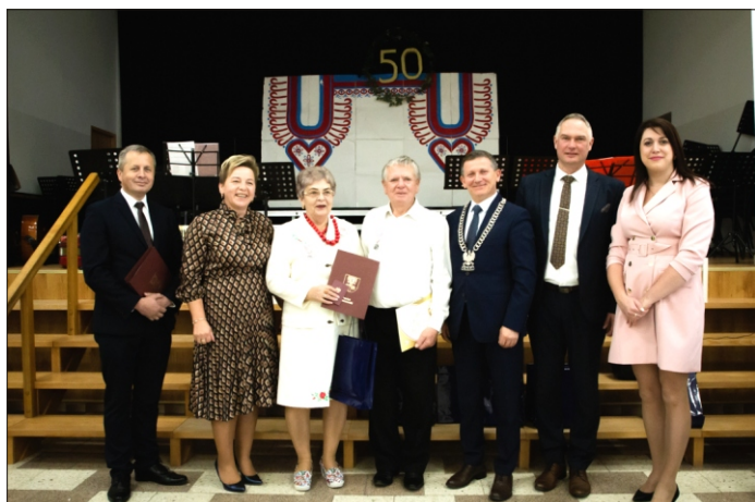
Uroczystość Złotych Godów małżeńskich