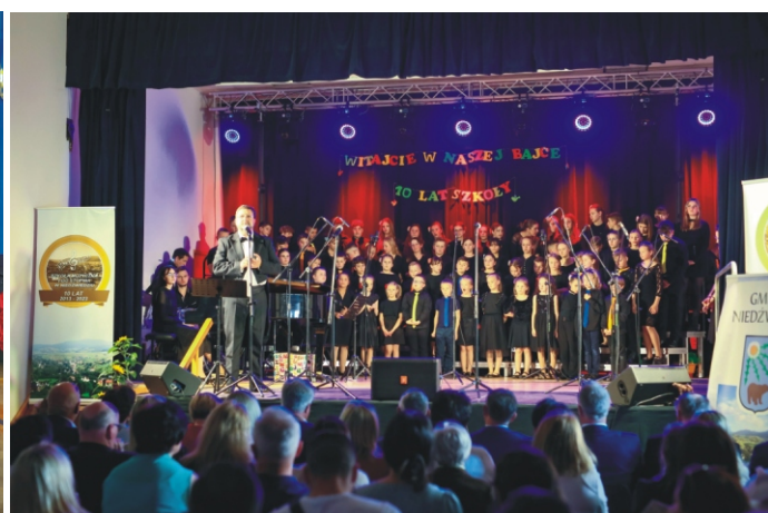
Jubileusz 10-lecia Szkoły Muzycznej w Niedźwiedziu

Wydawca: Urząd Gminy w Niedźwiedziu, 34 -735 Niedźwiedź, tel: 18 331 70 02 Zespół redakcyjny: Stanisław Stopa (opracowanie, skład komputerowy) Anna Liberda, Anna Stożek - współpraca redakcyjna Przygotowanie edytorskie - Paweł Dudek Adres internetowy: www.niedzwiedz.iap.pl Poczta elektroniczna: gmina@niedzwiedz.iap.pl Druk: MM - BDART Agencja Reklamowa. Tel.: 18 331 15 60 www.bdart.com.pl Pismo zrzeszone w Polskim Stowarzyszeniu Prasy Lokalnej