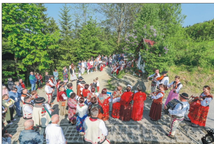
XXI Majówka u Orkana