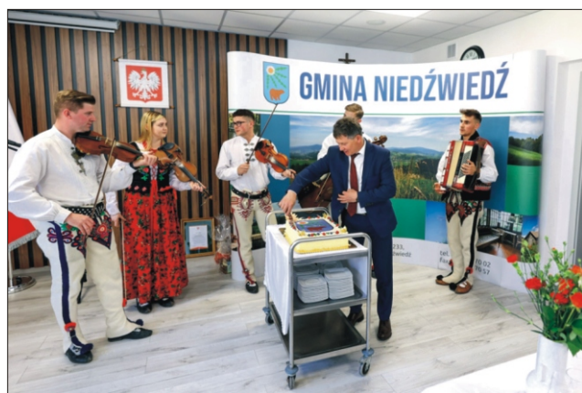
Poświęcenie i oficjalne oddanie do użytku zmodernizowanego budynku Urzędu Gminy