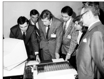
Wybory samorządowe w 1990 roku. Zagraniczni obserwatorzy.

Likwidacja Starostwa Powiatowego nastąpiła po wkroczeniu Niemców do Limanowej w 1939 r., a w to miejsce powołano Komisariat Krajowy. Natomiast na najniższym