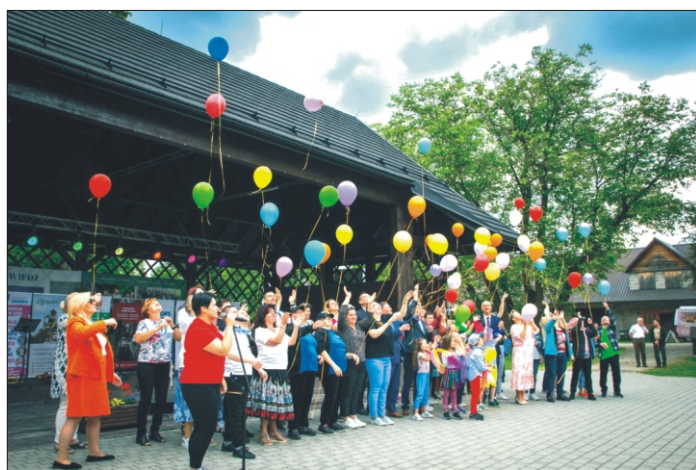
I Forum Osób Niepełnosprawnych