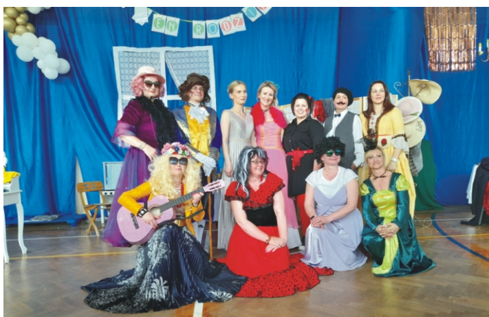
Dzień Rodziny w ZPO w Koninie