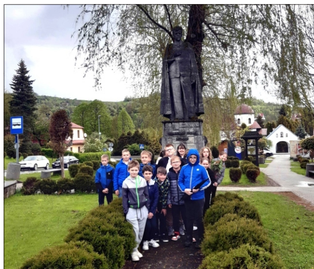
15 maja 2023 roku, uczniowie Szkoły Podstawowej im. Wł. Orkana w Porębie Wielkiej uczcili pamięć

Gdy w latach 70. w piśmie literackim ukazał się apel komitetu organizacyjnego dla uczestników obchodów stulecia urodzin Piewcy Podhala o przesyłanie wszelkich po nim pamiątek, wspomnień korespondencji itp., przekazałem poszerzone fragmenty moich reminiscencji, które o ile mi wiadomo, trafiły do Muzeum Wł. Orkana w Porębie Wielkiej (m. urodzenia poety).”