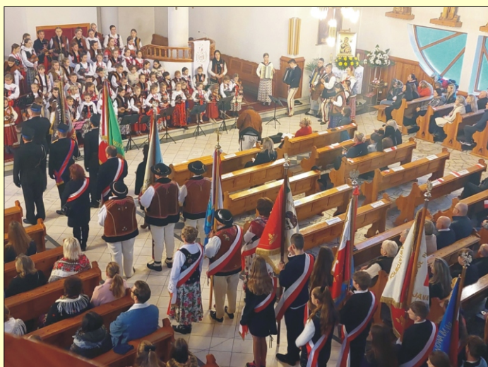
Gminne obchody Święta Niepodległości