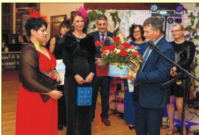
II Bal Seniora