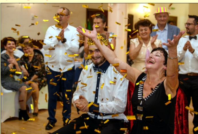
Król i Królowa Balu Seniora

Wydawca: Urząd Gminy w Niedźwiedziu, 34 -735 Niedźwiedź, tel: 18 331 70 02 Zespół redakcyjny: Stanisław Stopa (opracowanie, skład komputerowy) Anna Liberda, Anna Stożek - współpraca redakcyjna Przygotowanie i opracowanie wersji internetowej - Stanisław Stopa Adres internetowy: www.niedzwiedz.iap.pl Poczta elektroniczna: gmina@niedzwiedz.iap.pl Pismo zrzeszone w Polskim Stowarzyszeniu Prasy Lokalnej