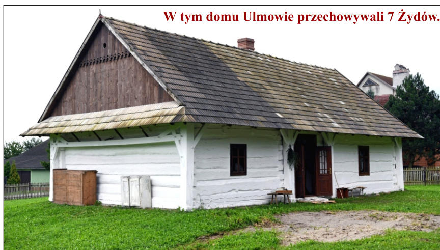
W tym domu Ulmowie przechowywali 7 Żydów.

Wiadomość o śmierci Ulmów oraz ukrywanych przez nich Żydów szybko obiegła całą wieś. Mimo surowego zakazu, po kilku dniach nocą 5 mężczyzn odkopało Ulmów i ciała włożono do trumien (2 większych i 2 mniejszych). Obok każdego z rodziców położyli po najmłodszym z dzieci, zaś starsze osobno. Wtedy zauważono, że w chwili śmierci (rozstrzelania) Wiktoria zaczęła rodzić dziecko. Najpierw pochowali je obok domu. Na cmentarz parafialny przeniesiono dopiero 17 stycznia 1945r. W lutym 1947r. ekshumowano ciała Żydów: Goldmanów, Grunfeldów, Didnerów i przeniesiono na cmentarz ofiar wojny w Jagielle-Niechciałkach. ➔ 8