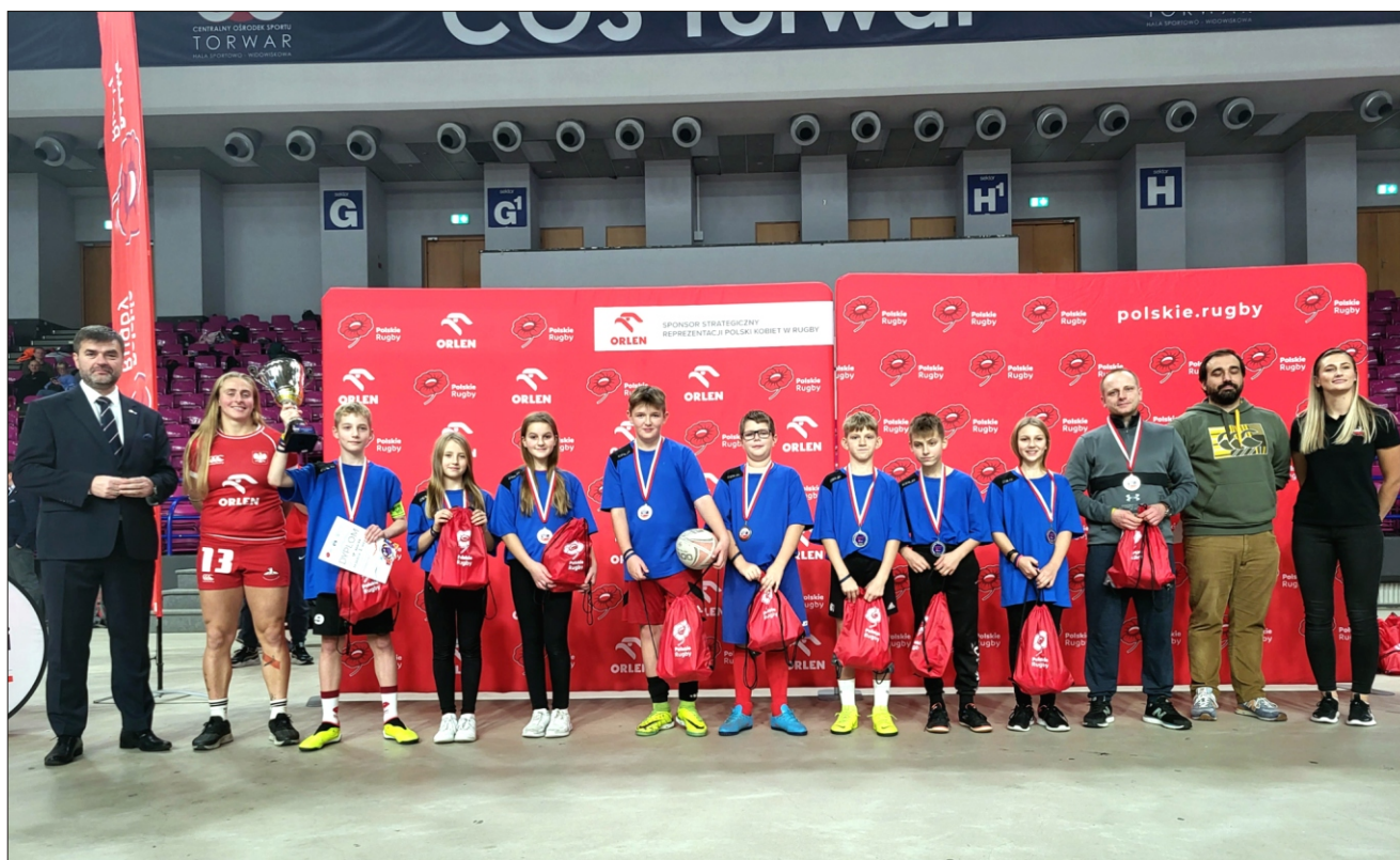
Rugbyści z Koniny wicemistrzem Polski