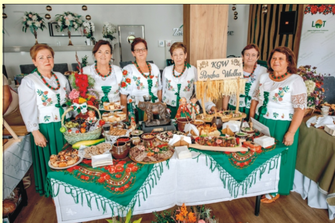
III Kongres Kół Gospodyń Wiejskich