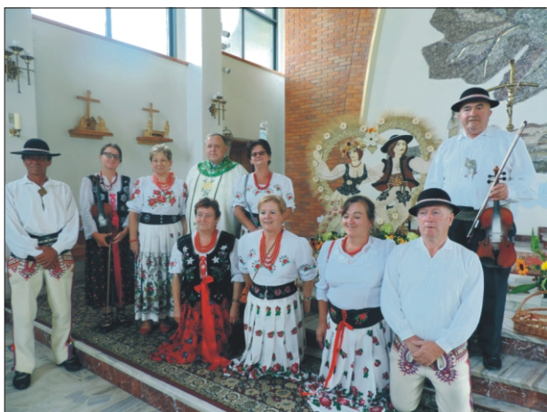
Dożynki Parafialne w Porębie Wielkiej