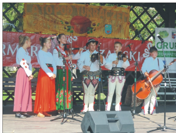
„Lato pod Turbaczem” - Gminny Zespół Regionalny