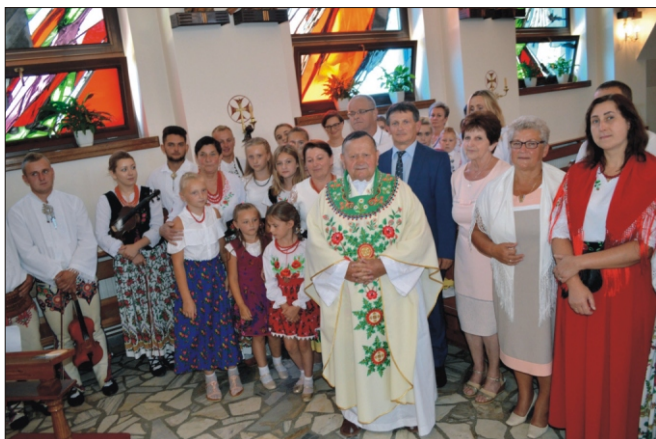
Dożynki Parafialne w Koninie