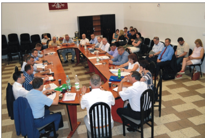
Sesja czerwcowy Rady Gminy