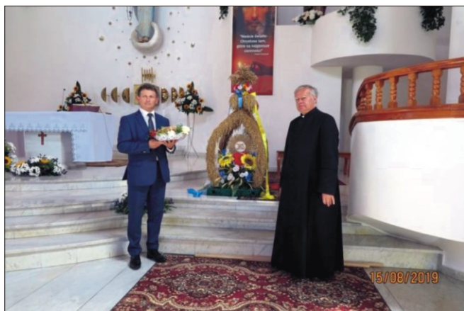
Dożynki Parafialne w Niedźwiedziu