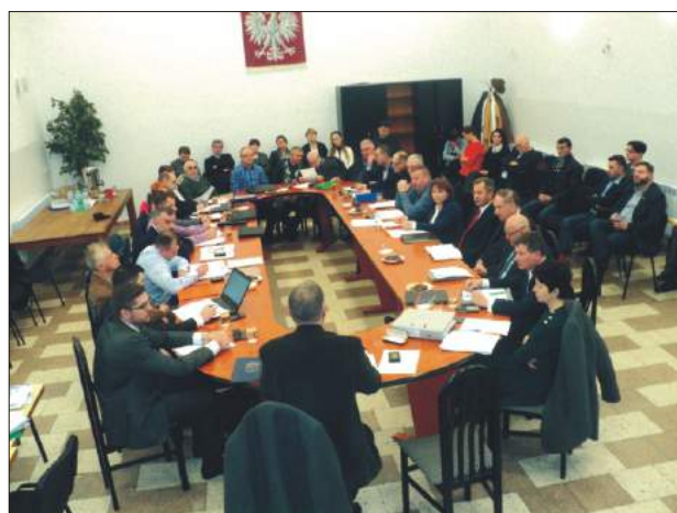
Styczniowa sesja Rady Gminy