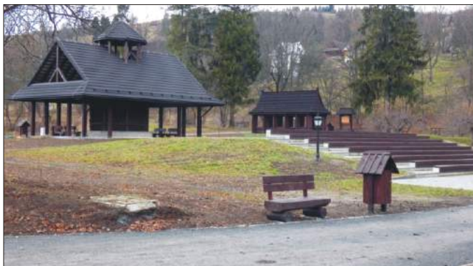
Tężnia solankowa i amfiteatr odebrane