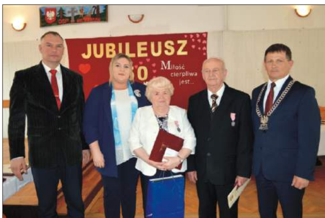
Uroczystość 50-lecia pożycia małżeńskiego