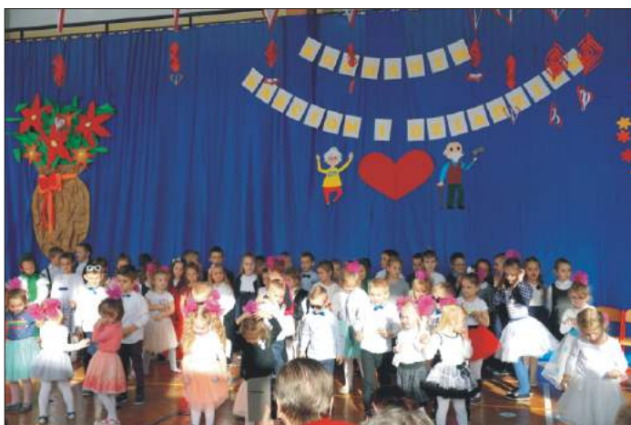
Święto Babci i Dziadka w Koninie