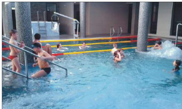
Basen w Zakładzie Balneologicznym w Porębie Wlk.