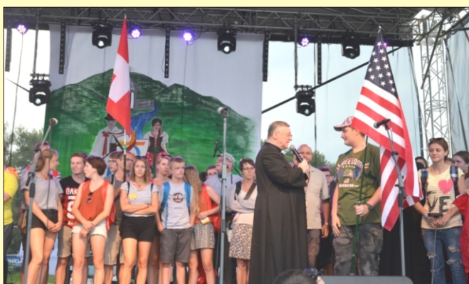
Światowe Dni Młodzieży w Mszanie Dolnej