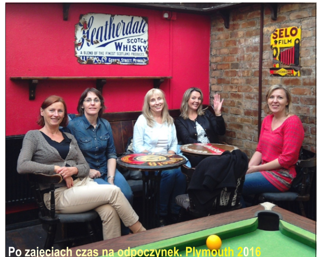
Po zajęciach czas na odpoczynek. Plymouth 2016

EDUinspirator to osoba, która działa w dziedzinie edukacji na rzecz rozwoju innych osób lub wspierania rozwoju