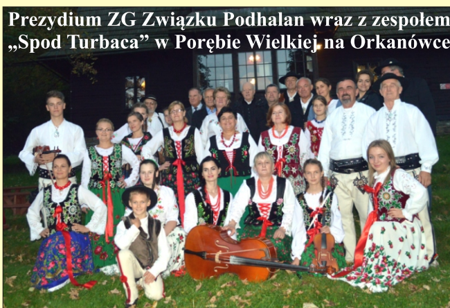
Prezydium ZG Związku Podhalan wraz z zespołem „Spod Turbaca” w Porębie Wielkiej na Orkanówce

Wydawca: Urząd Gminy w Niedźwiedziu 34 -735 Niedźwiedź, tel: 18 331 70 02 Zespół redakcyjny: Stanisław Stopa (opracowanie, skład komputerowy) Anna Liberda - współpraca redakcyjna Przygotowanie i opracowanie wersji internetowej - Stanisław Stopa Adres internetowy: www.niedzwiedz.iap.pl Poczta elektroniczna: gmina@niedzwiedz.iap.pl Pismo zrzeszone w Polskim Stowarzyszeniu Prasy Lokalnej.