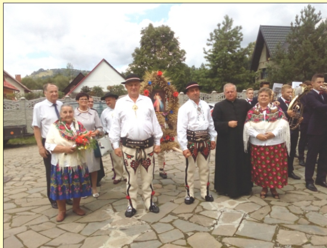
Dożynki parafialne w Niedźwiedziu