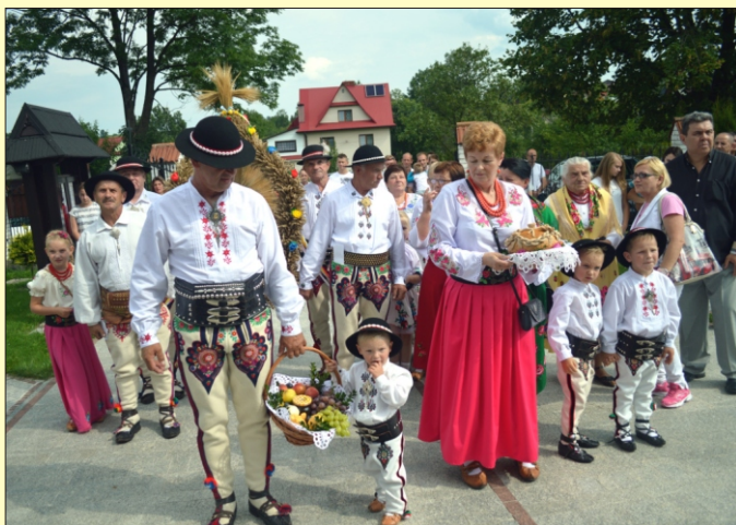
Dożynki parafialne w Koninie