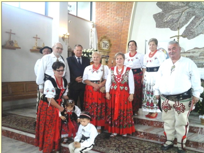
Dożynki parafialne w Porębie Wielkiej