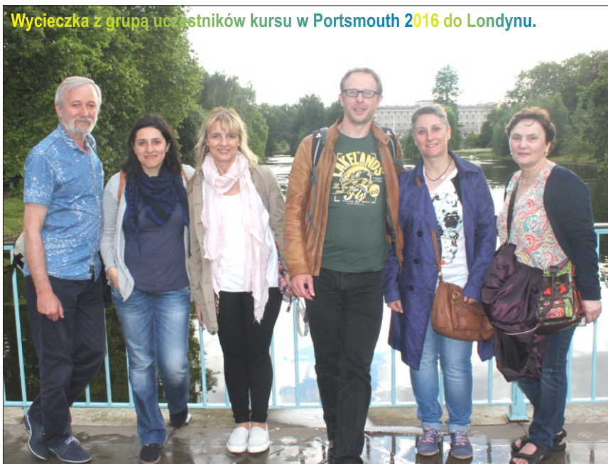
Wycieczka z grupą uczestników kursu w Portsmouth 2016 do Londynu.

szym celem działań kadry szkolnej. Nie możemy jednak planować tych projektów bez większej liczby nauczycieli odpowiednio do tego przygotowanej.