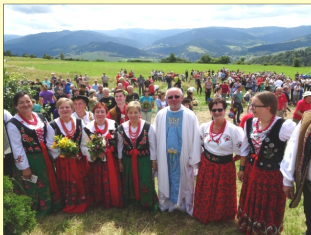
Msza święta na Górze Potaczkowej