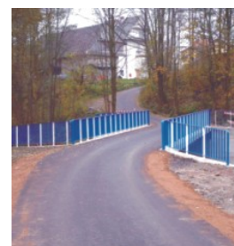
Nowy most u Trojaka w Koninie

Wydawca: Urząd Gminy w Niedźwiedziu. 34-735 Niedźwiedź. Telefon: /018/ 3317-002