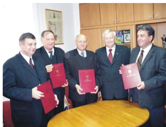
Akt notarialny jest! Czy będą baseny w Porębie?