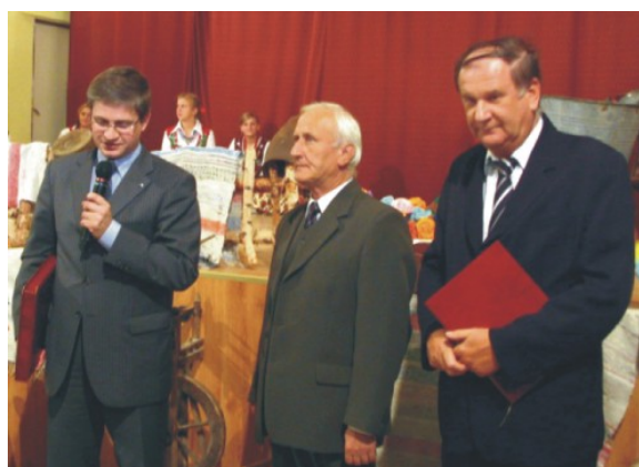
Minister P. Soloch - naszym Honorowym Obywatelem