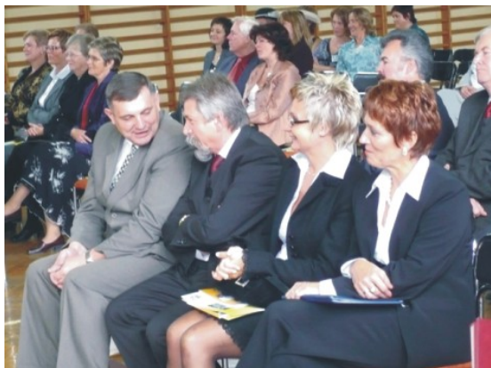
100 lat Domu Wczasów Dziecięcych w Porębie Wlk.