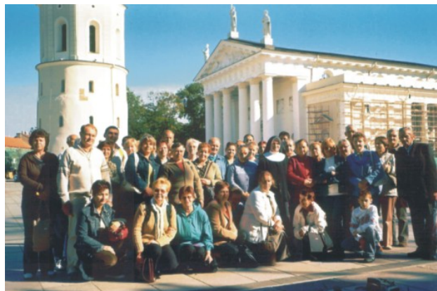
Parafialna pielgrzymka z Niedźwiedzia