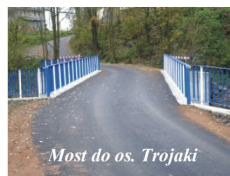
Most do os. Trojaki