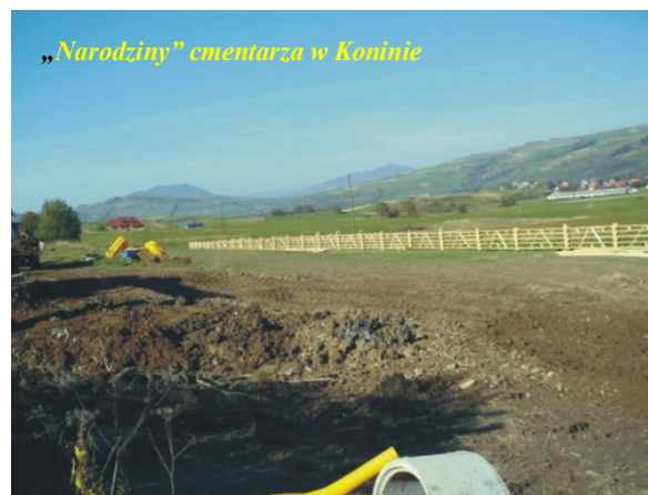
„Narodziny” cmentarza w Koninie