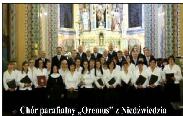
Chór parafialny „Oremus” z Niedźwiedzia

Wydawca: Urz d Gminy w Nied wiedziu 34 -735 Nied wiedz , tel: 18 331 70 02 Zespół redakcyjny: Stanisław Stopa (opracowanie, skład komputerowy) Anna Liberda, Maria Lupa - współpraca redakcyjna Opracowanie i przygotowanie wersji internetowej - Stanisław Stopa Adres internetowy: www.niedzwiedz.iap.pl Poczta elektroniczna: gmina@niedzwiedz.iap.pl Druk: MM - Limanowa, tel. 18 337 01 10, www.mm.limanowa.pl Pismo zrzeszone w Polskim Stowarzyszeniu Prasy Lokalnej.