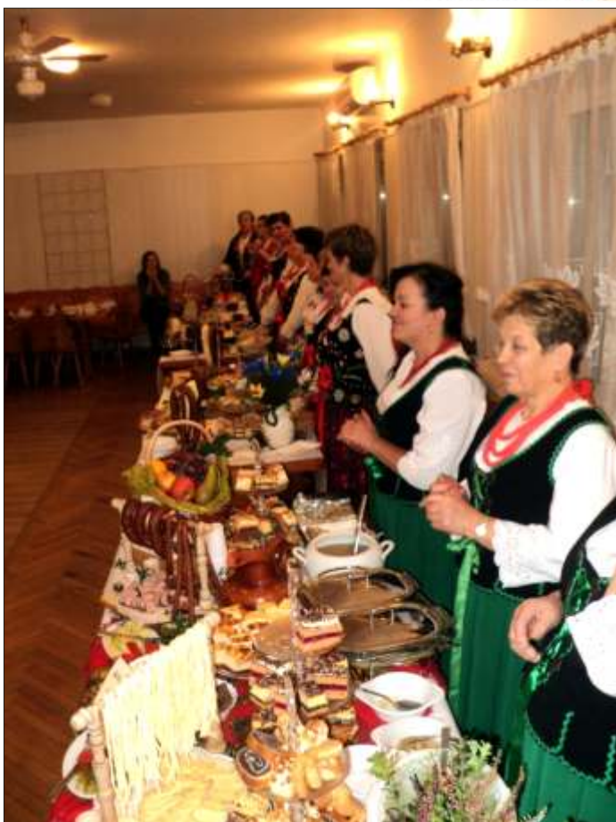
X Konkurs Potraw Regionalnych w Niedźwiedziu