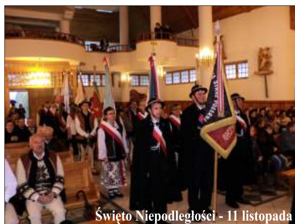
Święto Niepodległości - 11 listopada