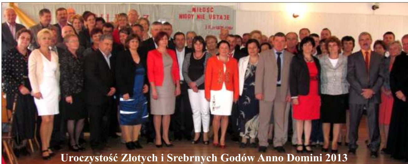
Uroczystość Złotych i Srebrnych Godów Anno Domini 2013