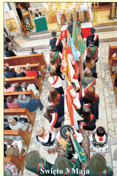
Święto 3 Maja