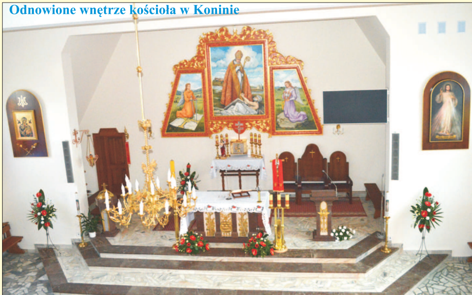
Odnowione wnętrze kościoła w Koninie