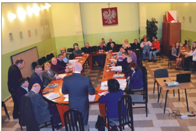
Marcowa sesja Rady Gminy