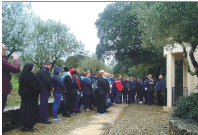
Parafialna pielgrzymka z Niedźwiedzia do Fatimy w 100 rocznicę Objawień Fatimskich