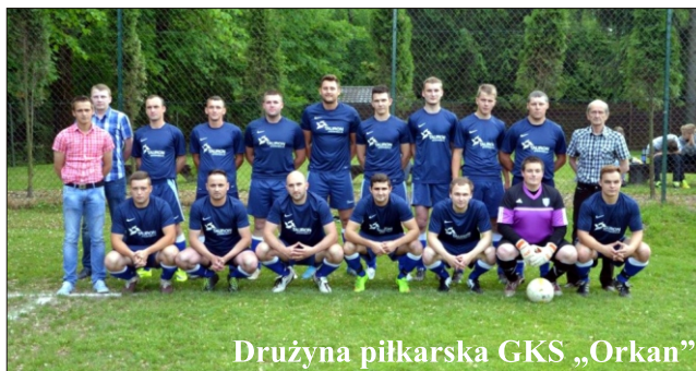
Drużyna piłkarska GKS „Orkan”.