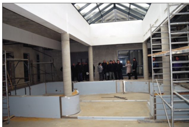
Budowa zakładu balneologicznego w Porębie Wielkiej - wygląd z zewnątrz i wewnątrz

Wydawca: Urząd Gminy w Niedźwiedziu 34 -735 Niedźwiedź, tel: 18 331 70 02 Zespół redakcyjny: Stanisław Stopa (opracowanie, skład komputerowy) Anna Liberda - współpraca redakcyjna Przygotowanie i opracowanie wersji internetowej - Stanisław Stopa Adres internetowy: www.niedzwiedz.iap.pl Poczta elektroniczna: gmina@niedzwiedz.iap.pl Pismo zrzeszone w Polskim Stowarzyszeniu Prasy Lokalnej.