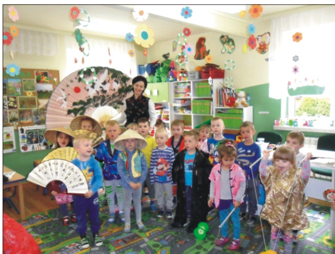
Z wizytą u przedszkolaczków w Niedźwiedziu

Wydawca: Urząd Gminy w Niedźwiedziu 34 -735 Niedźwiedź, tel: 18 331 70 02 Zespół redakcyjny: Stanisław Stopa (opracowanie, skład komputerowy) Anna Liberda - współpraca redakcyjna Opracowanie i przygotowanie wersji internetowej - Stanisław Stopa Adres internetowy: www.niedzwiedz.iap.pl Poczta elektroniczna: gmina@niedzwiedz.iap.pl Pismo zrzeszone w Polskim Stowarzyszeniu Prasy Lokalnej.