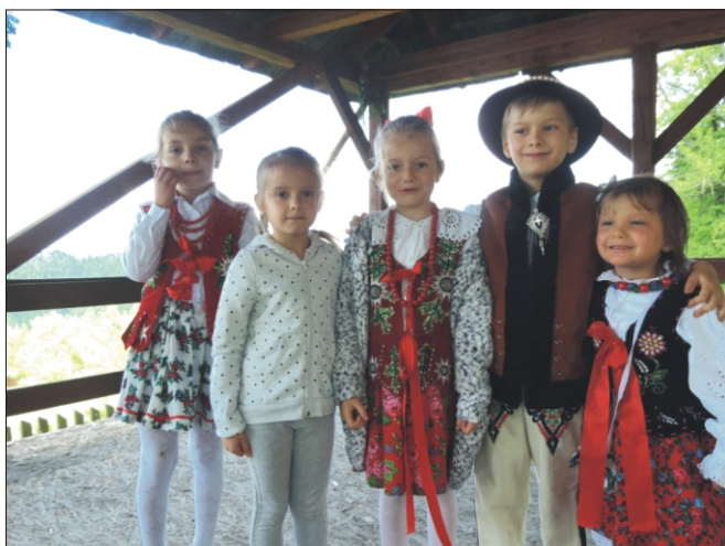
Jubileuszowy Zlot szkół im. Władysława Orkana