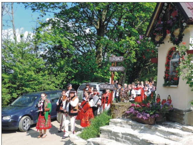
„Majówka u Orkana”, Anno Domini 2017