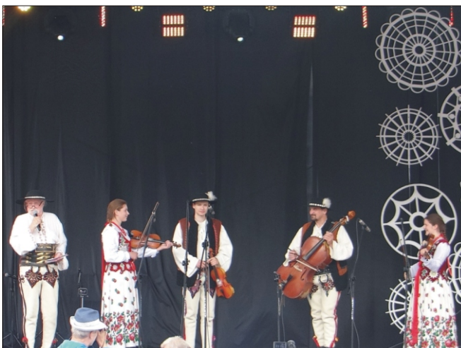
„Gorcianie” zdobywcami „Złotych Basów” w Podegrodziu