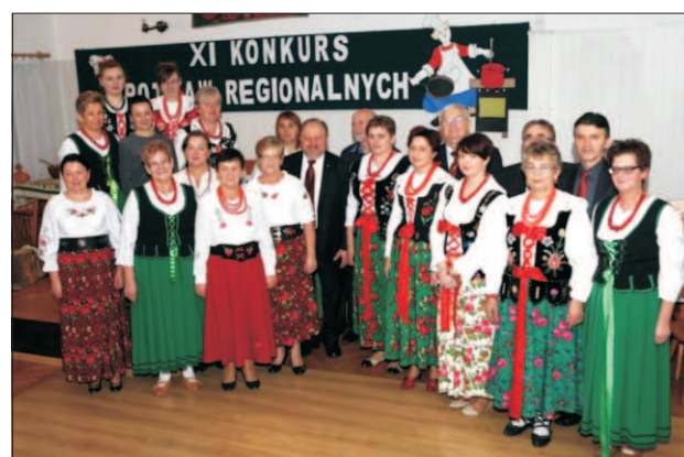
Konkurs Potraw Regionalnych