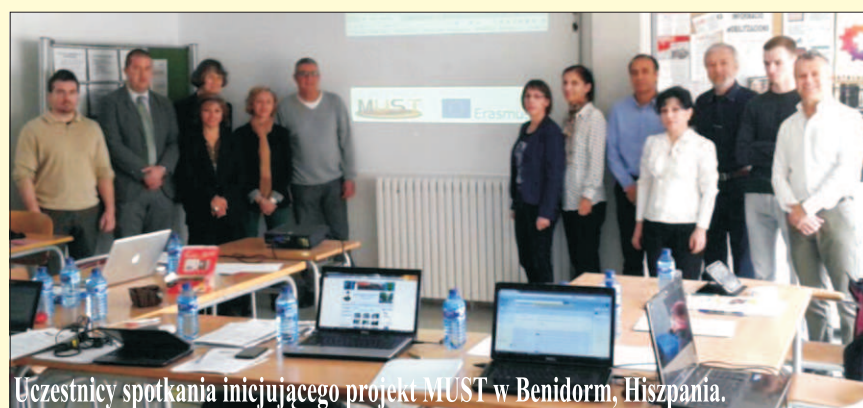
Uczestnicy spotkania inicjującego projekt MUST w Benidorm, Hiszpania.

Czas realizacji projektu przewidziany jest na 2 lata, w którym to czasie kurs będzie tworzony, tłumaczony na języki narodowe partnerów, rozpowszechniany wśród nauczycieli, testowany przez nauczycieli i uczniów i wreszcie udostępniony jako MOOC, czyli masowy otwarty kurs online dla uczniów