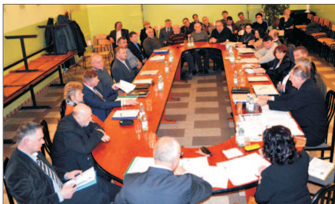
Sesja nowo wybranej Rady Gminy