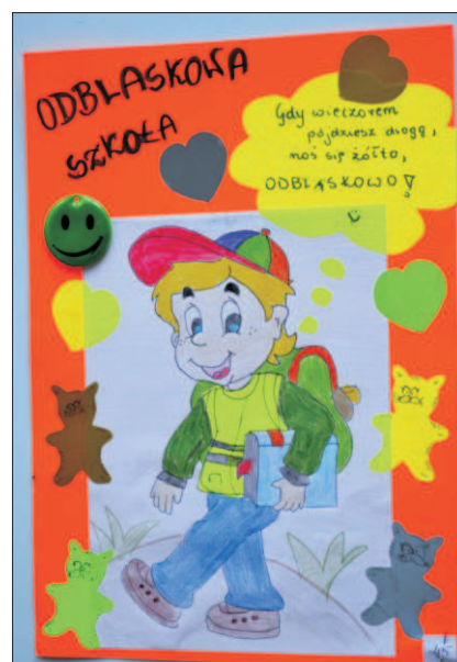
Martyna Zapala - kl. Vb