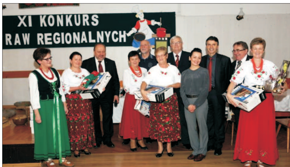
Konkurs Potraw Regionalnych